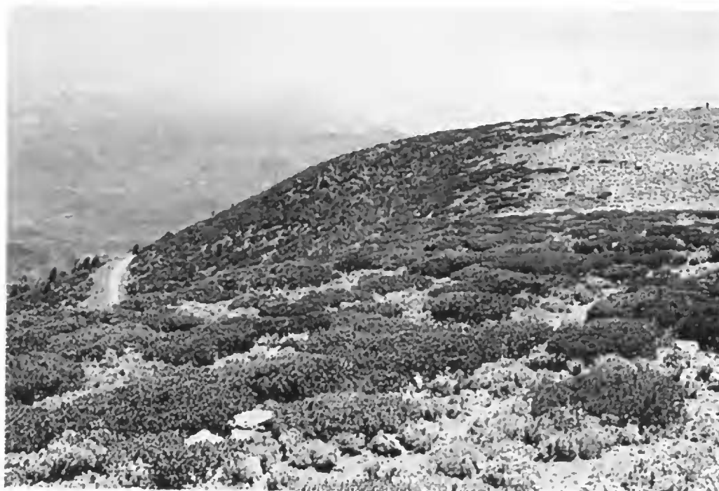
Fig. 3. Matorral de Pinus culminicola . Pradera subalpina en extremo superior derecho.

Una asociación común en el ecotono con la pradera subalpina es la de Pinus culminicola rodeado por Senecio loratifolius y Lupinus cacuminis . En las áreas de matorral abierto se presenta una diversidad florística relativamente alta, la cual disminuye conforme la comunidad se torna más densa.